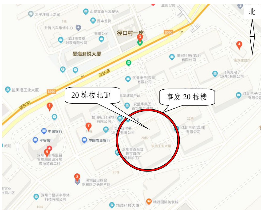
图1 施工地点位置图

订了《相关方安全协议书》，2021年10月28日才众电脑（深圳）有限公司向沙保物业进行了小散工程作业的备案，2021年11月1日才众电脑（深圳）有限公司与广东新恒基建设工程有限公司签订了“才众电脑（深圳）有限公司20栋4楼南北面消防整改工程”施工合同，工程地点：深圳市盐田区深盐路2015号沙头角保税区20栋4楼南北面，合同金额为47万元（人民币），工程主要包括消防栓移位、修改喷淋、安装机械排烟管道、消防烟感移位、更换消防安全门等作业内容。事发时工程正在进行20栋楼北面施工（具体位置见图1所示）。