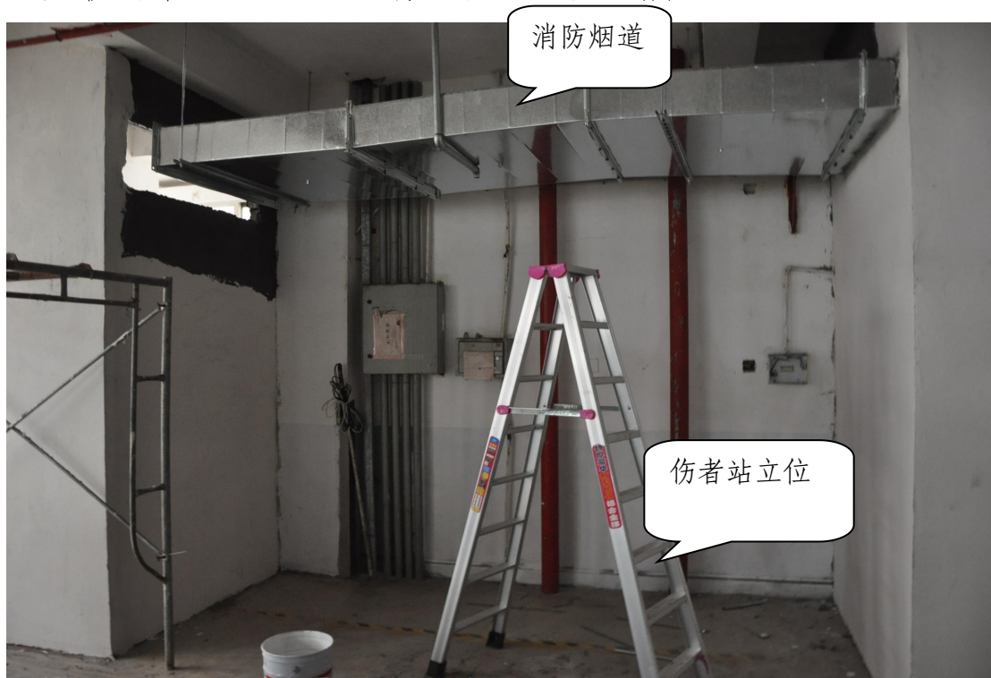
图 3 施工现场图

50 分左右，吕某龙看到同伴在安装管道，就登上铝质人字梯站在第三档上斜身于梯子一侧帮扶上方消防烟道，由于侧向力的作用，梯子突然向另一侧滑动，吕某龙身体重心失稳摔下，头枕部着地。施工现场见图 2、图 3 所示。