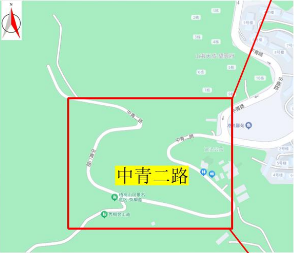
附件 1：项目位置及实施范围图