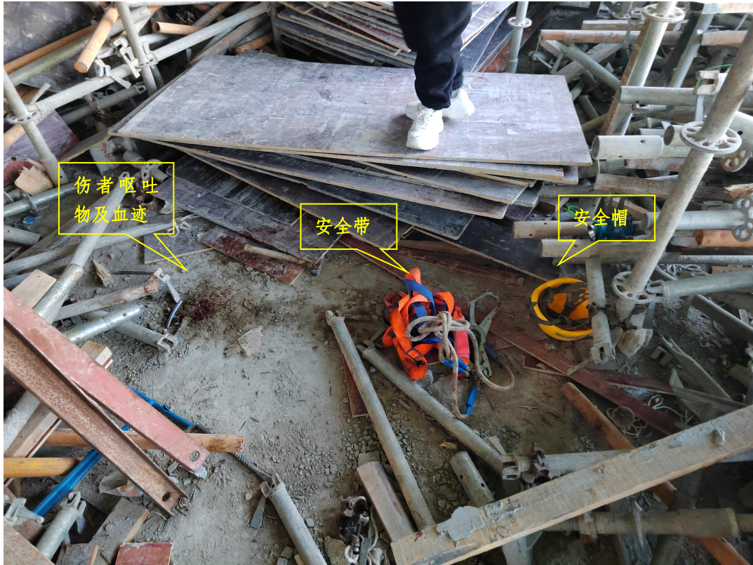
图9 事故人员坠落位置