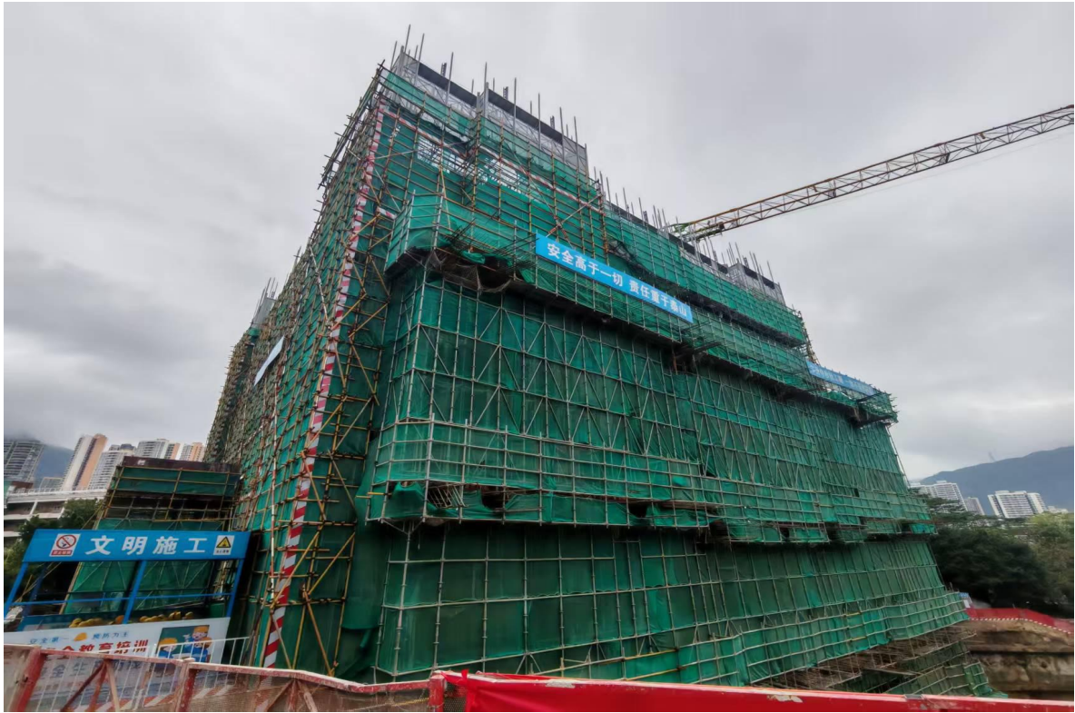
图 5 涉事楼栋