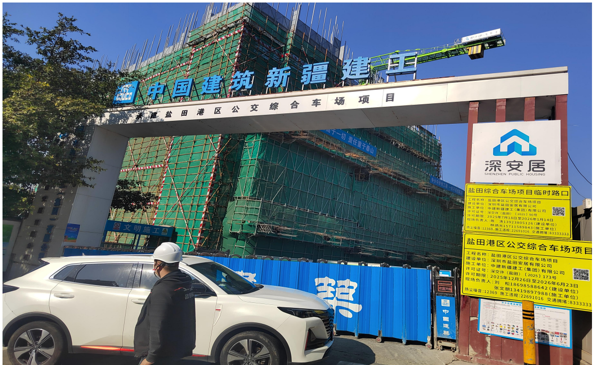
图 4 项目工地出入口