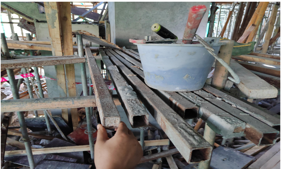
图 7-3 作业平台