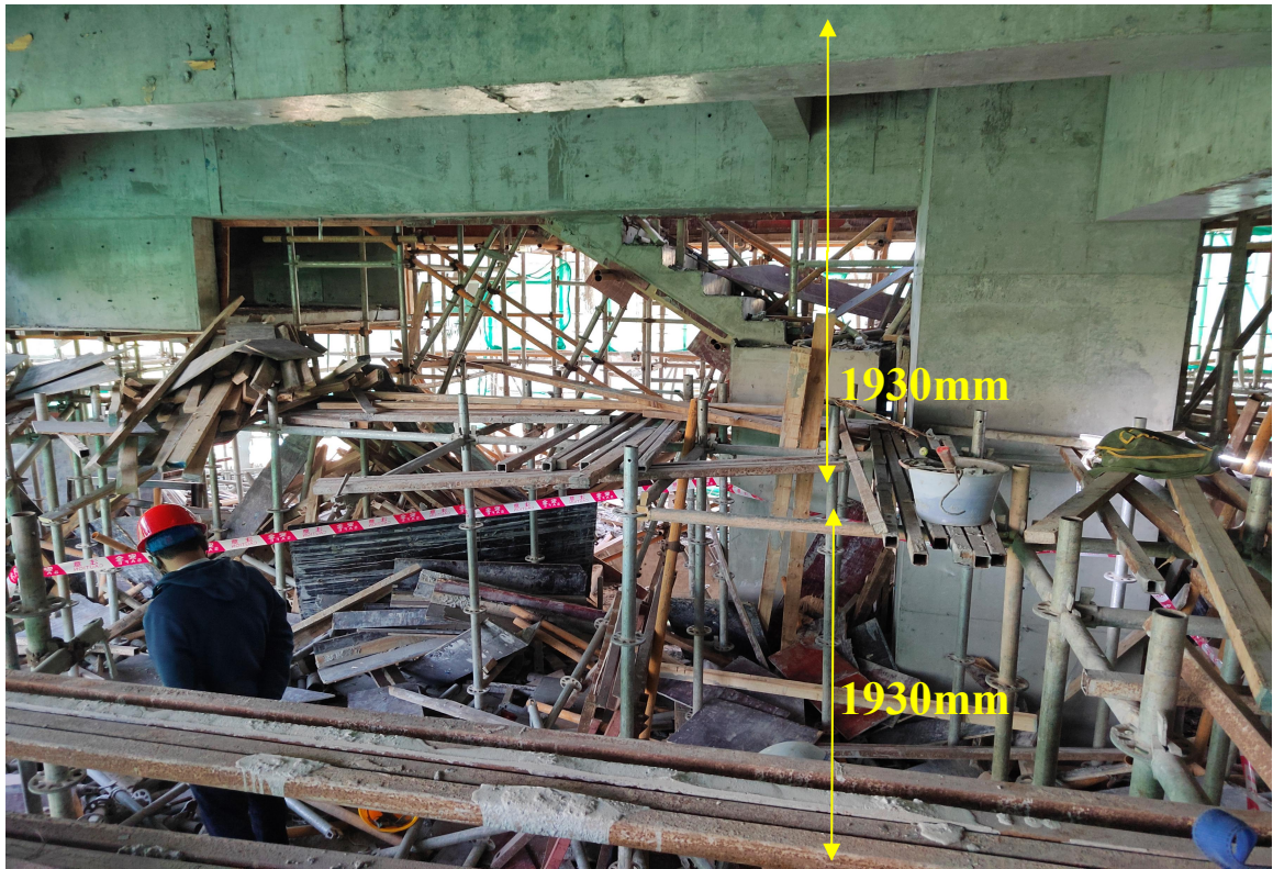
图 7-2 作业平台