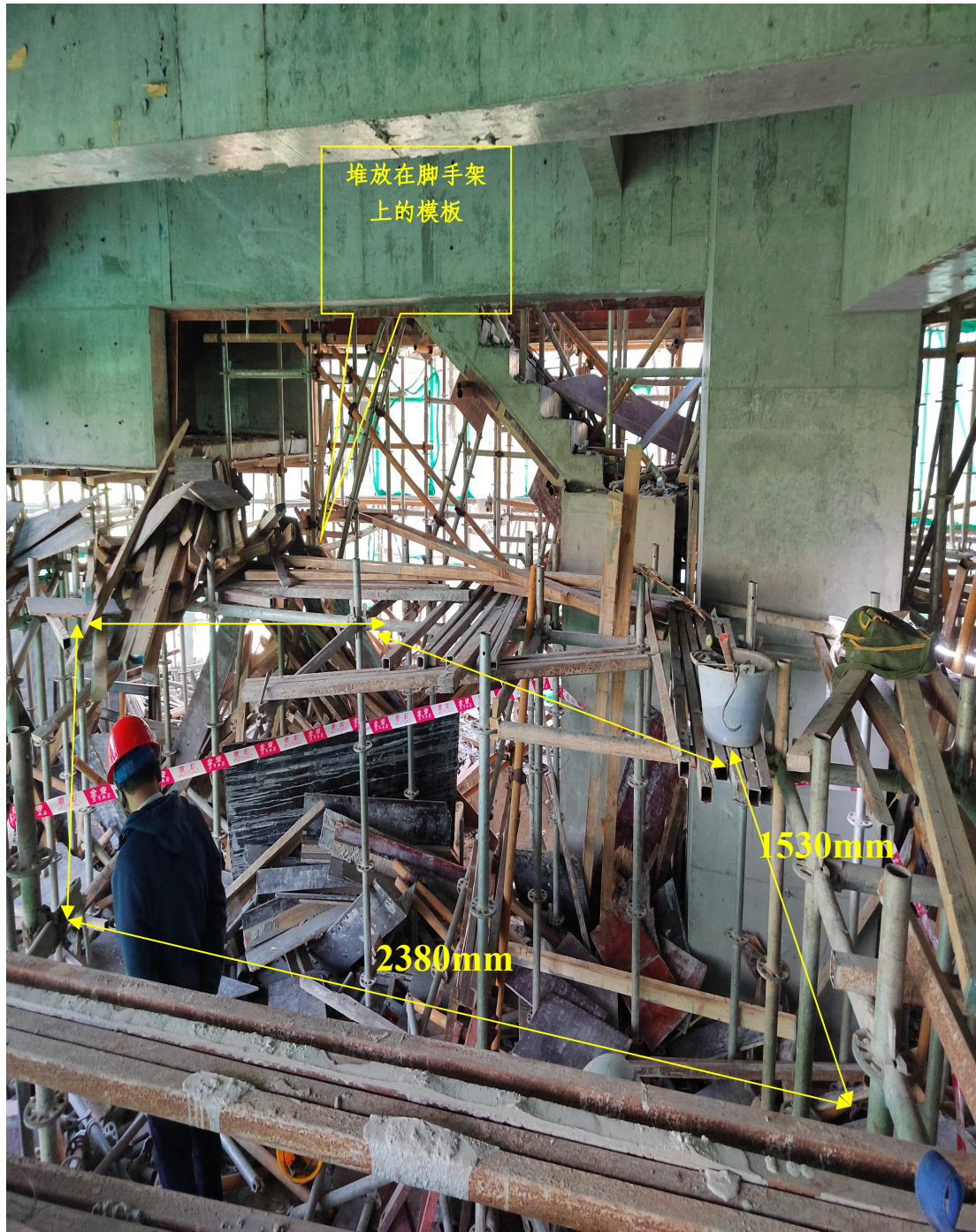
图 8 事故人员坠落区域

3. 坠落区域情况：事故人员坠落区域的盘扣式脚手架自上而下已拆除，该区域为长约 2380mm，宽约 1530mm 的不规则形状。