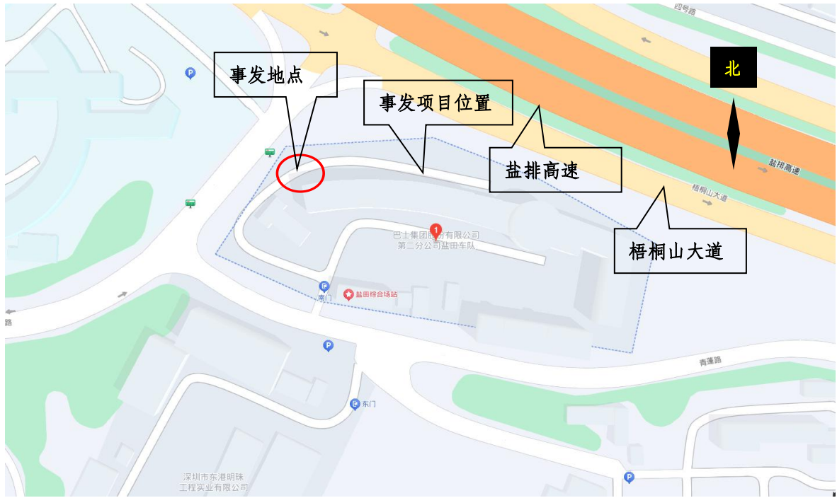
图1 项目位置示意图