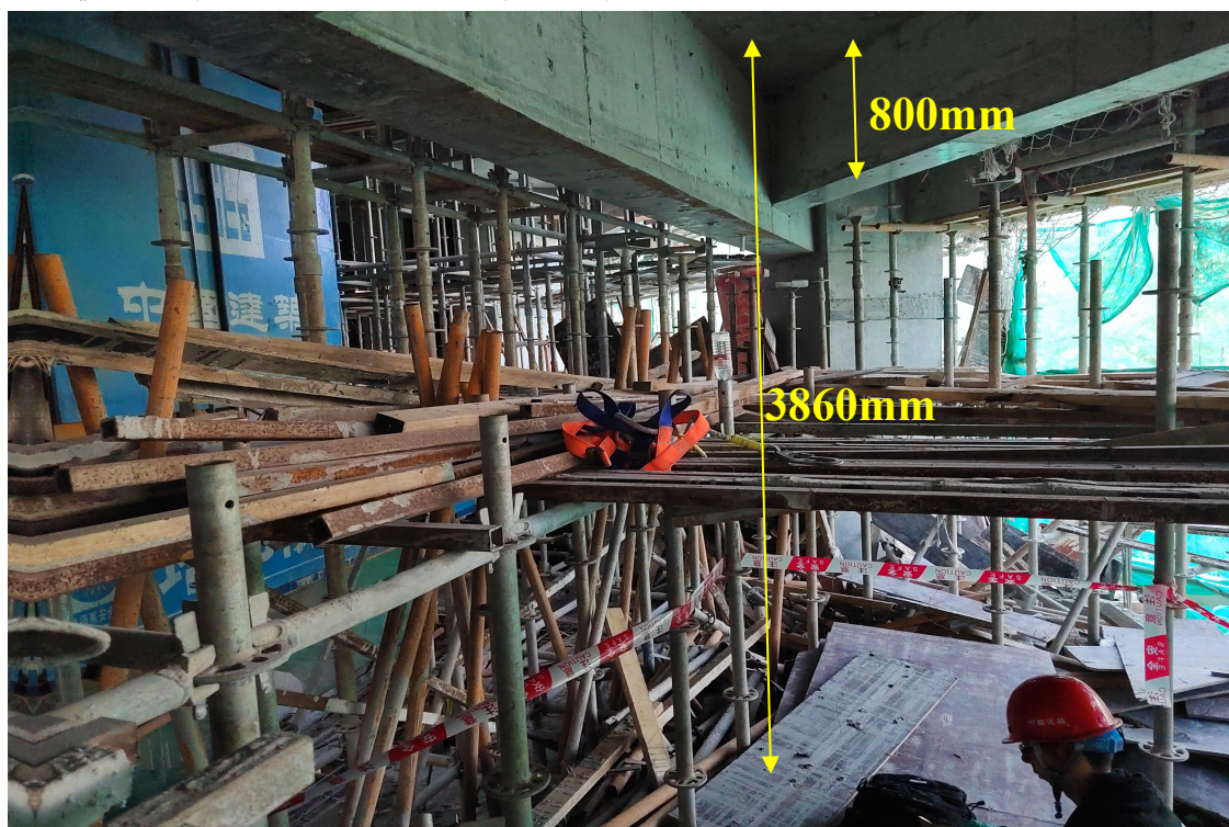
图 6 涉事楼层情况

1. 事故楼层情况: 事故发生位置位于1栋1单元首层东北角，事故楼层高度约为 3860mm, 梁高约为 800mm。