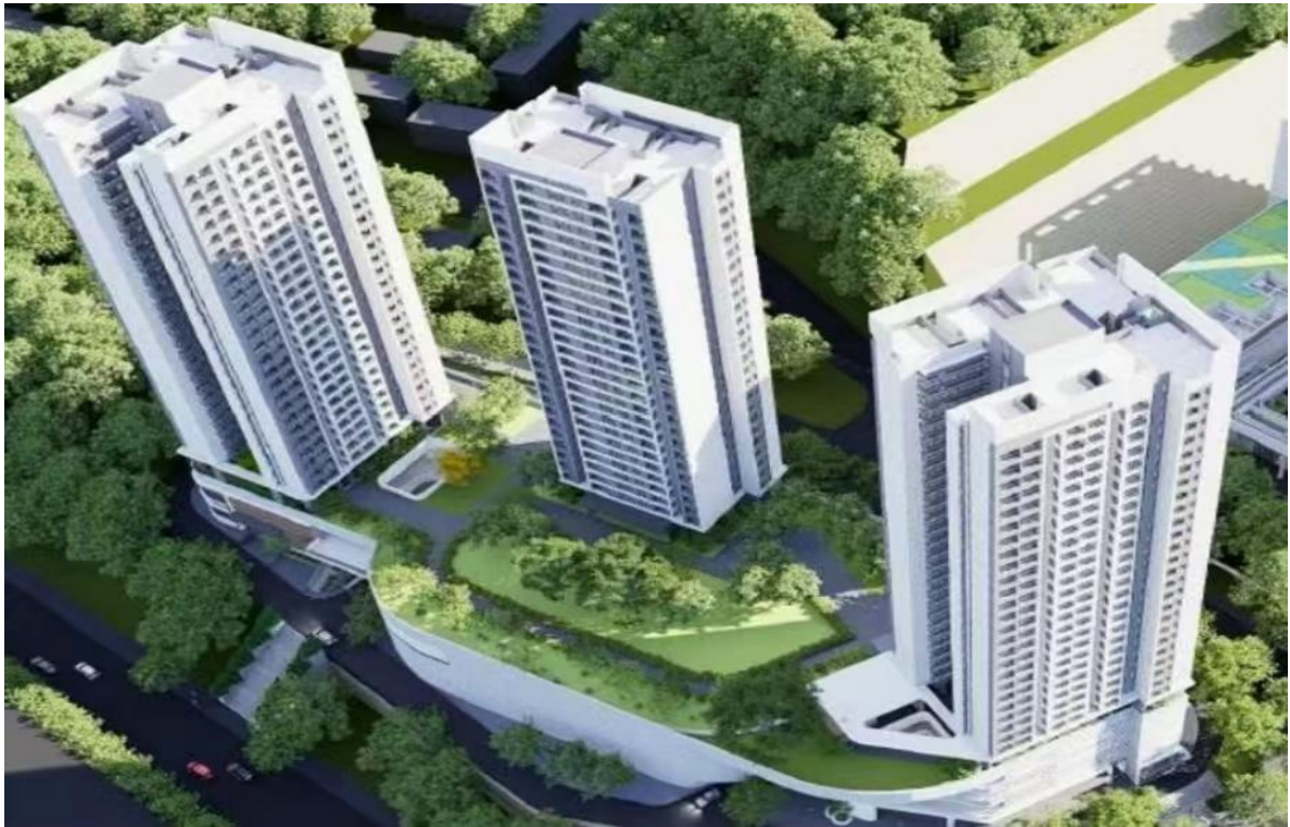
图 3 效果图